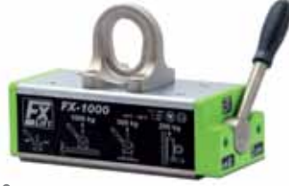
FX : Düz ve yuvarlak kesitli malzemeleri kaldırmaya uygun