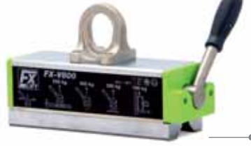
FX - V : Profil, kiriş ve sıcak malzemeleri kaldırmaya uygun. (150°C)