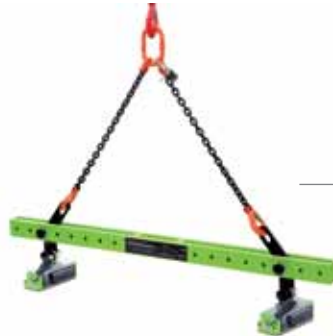
FX - LT : 2 bacaklı zincir sapanlı traversli miknatıs