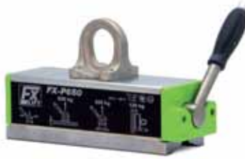
FX - P : 12 mm'den ince plakaları ve boruları kaldırmaya uygun (Lazer kesim sistemi için uygun)