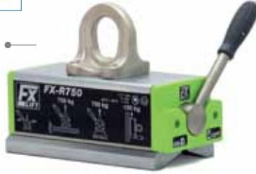
FX - R: Çoğunlukla dairesel kesitli olan ve/veya sıcak malzemeleri kaldırmaya uygundur.