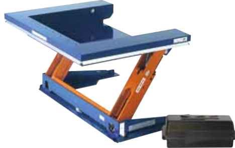
ALT 1500 GB