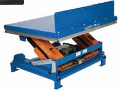
ART 1500 GV