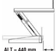
ALT = 440 mm ART = 300 mm