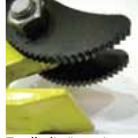
Tırtıllı diş örneği