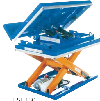
ESL 130, TL 2000 üzerine monte edilmiş olarak