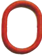
Ana bağlantı halkası 1 ve 2 bacaklı sapanlar için.