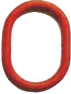
Ana bağlantı halkası 1 ve 2 bacaklı sapanlar için.