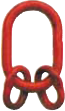
Ana bağlantı halkası 3 ve 4 bacaklı sapanlar için.